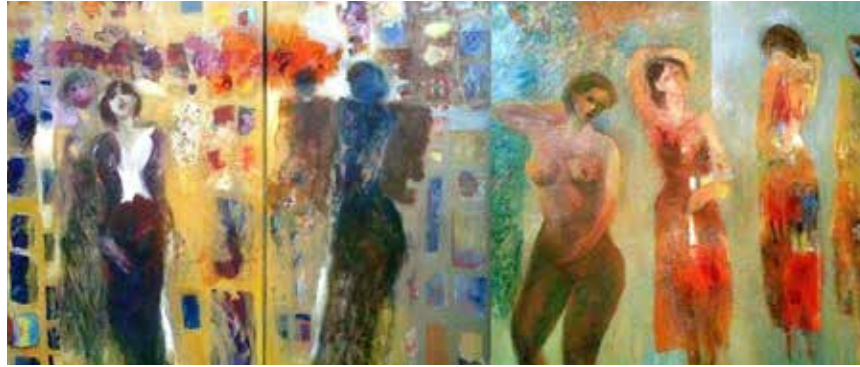
العمل الفني: خليل عبد القادر

لم تكن هذه الورشة جديدة في المكان، بل هي إحياء لورشة سابقة تقام دورياً كل أسبوع منذ حوالي ثلاث سنوات،