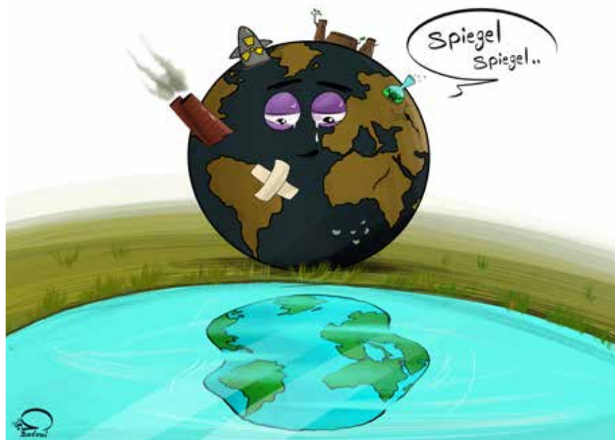
كاركاتير: عبدالمهيمن بدوي