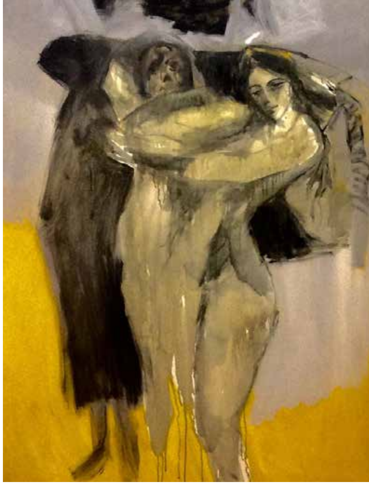
العمل الفني: خليل عبد القادر

لم يكتفِ بالتهام الدجاج أمامي، صار يرمي بالدجاجة المشوية ذات الرأس المقطوع على وجهي عندما أكون نائماً، أو يضعها على وسادتي جانب رأسي، لأشاهد جنيناً بشرياً مقطوع الرأس