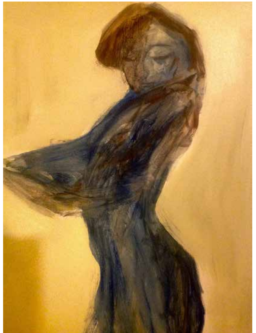
Artwork: Khalil Abd Al Kader